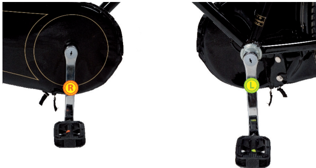
Rechts bij rechts

1. Zoek het juiste pedaal bij de juiste crank. Het pedaal met de letter "L" hoort bij de crank "L", het pedaal met de letter "R" hoort bij de crank "R". Ofwel groen (L) bij groen (L) en oranje (R) bij oranje (R). Rechts is de zijde waar ook het tandwiel zit. (zie afbeelding)